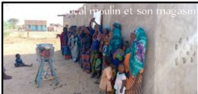
Achat de moulin à grain pour les femmes d'Intédéné