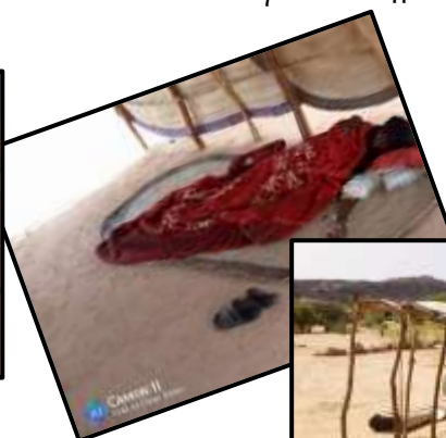
Hangars construits pour les malades à In Issili.