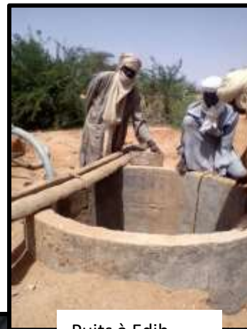
Puits à Edib

Rénovation du toit de l'école à Kerboubou: le 13 septembre, une forte tornade a arraché la toiture de deux classes de l'école de Kerboubou.