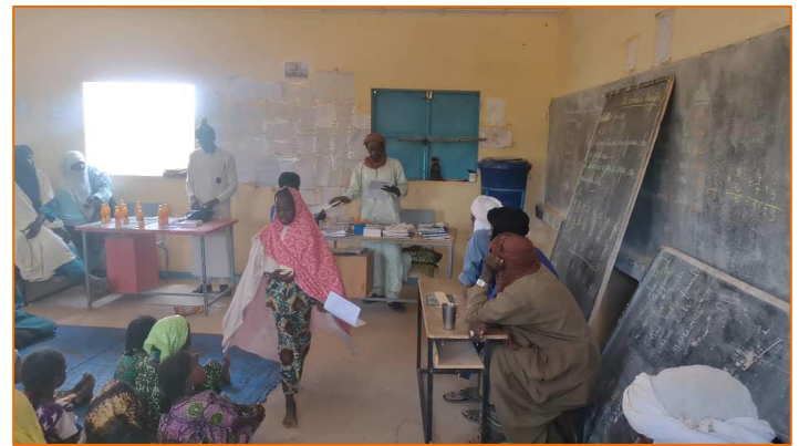
Fête scolaire et remise des résultats de compositions