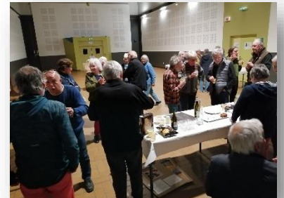
Moment de partage autour d'un apéro...

Elle prépare un festival sur le Sahara au Fort Barraux en juin 2024.